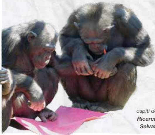
Caterina e Lucy, ospiti del Centro Tutela e Ricerca Fauna Esotica e Selvatica Monte Adone

Durante la mostra e i convegni saranno proiettati video dall'archivio storico del Centro e immagini realizzate da POPcult.